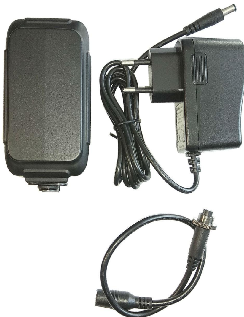
Фото 1 (комплект поставки).

Устройство, адаптер 220/12В для зарядки, кабель переходник, гарантийный талон, магнитный держатель(опция), SIM-карта(опция).