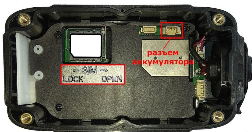
Фото 2 (установка SIM-карты).

Поместите SIM-карту формата Micro-SIM (3FF) согласно пазам в слот, закройте держателем и сдвиньте держатель до щелчка согласно стрелке у надписи LOCK, зафиксировав её.