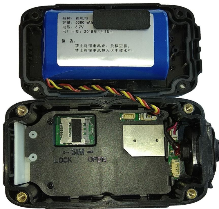
Фото 3 (подключение аккумулятора).

Подключите основной аккумулятор, ориентируя пазы разъема (см.фото 3), закройте крышку устройства аккуратно проложив кабель от аккумулятора. Крышку сориентируйте относительно резиновой заглушки разъема, которую установите в паз (см.фото 4).