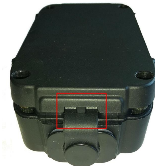
Фото 4 (монтаж заглушки).

При монтаже опционального магнитного держателя отвинтите 4 винта шестигранником на 2.5 мм, не снимая крышку устройства, приложите держатель к крышке и закрутите винты.